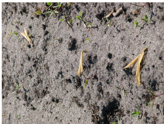
Billede 1. Majsplanter svedet af nattefrost. Billedet er taget den 6. maj 2011 om morgenen.

I Sortsforsoget i Holstebro er der givet karakterer fra 1 til 4 for kulderesistens, hvor 0 er helt nedvisne planter og 10 er grønne upåvirkede planter. Resultaterne kan ses på www.nfts.dk . Forskellene mellem sorter er dog ikke større end forskelle mellem planter i samme sårække eller mellem sårækker. Det kan skyldes forskelle i udviklingsstadiet, da frosten kom. Det kan også skyldes forskelle i planternes vigør, som følge af forskelle i vækstvilkår og frøkvalitet.