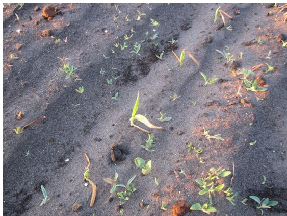
Billede 3. Majsplanter, som er begyndt at sætte nye blade. Billedet er taget i samme mark som billede 1 og 2. Billedet er taget 9. maj 2011 om morgenen, dvs. 3 døgn efter billede 1 og 2 er taget.